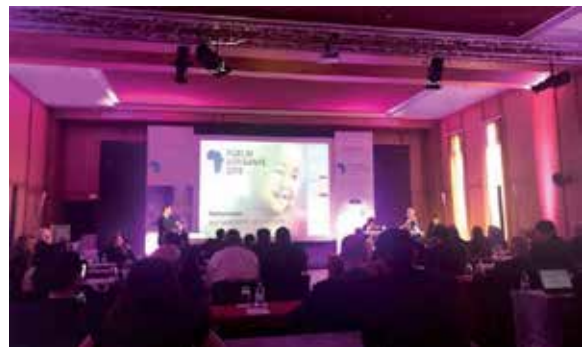
Cette rencontre se veut une plateforme pour des rencontres B2B d'échanges, ainsi qu'une véritable vitrine de découverte des dernières nouveautés et innovations dans le secteur de la santé au niveau continental.

Dans une allocution lue en son nom, le ministre tunisien de la Santé, Imed Hammami, a mis l'accent sur l'importance de mutualiser les bonnes volontés et d'échanger autour de stratégies pour booster la performance, à travers l'échange d'expérience en matière de financement, de maîtrise des coûts, de formation du personnel et de complémentarité entre les secteurs public et privé, outre le renforcement de la coopération en matière de recherche, de sécurité et de veille sanitaire.