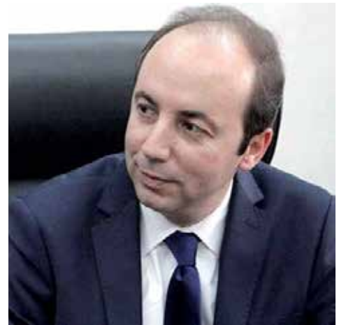
«Le système africain de santé est marqué par des inégalités d'accès aux soins».

Il s'agit, selon le ministre de la santé, de «la couverture sanitaire universelle, du financement, du coût d'accès aux services de soin et de la consolidation de programmes de santé, notamment celle infantile». Le ministre, qui estime que l'évaluation de la performance d'un pays est un exercice complexe, voire nécessaire pour mener des réformes, ne manque pas d'évoquer l'expérience du Royaume. Comme il le rappelle, le Maroc s'est engagé depuis 2015 dans des réformes pour lutter contre les inégalités, voire répondre aux besoins de certaines couches sociales, notamment les femmes et les personnes à besoins particuliers.