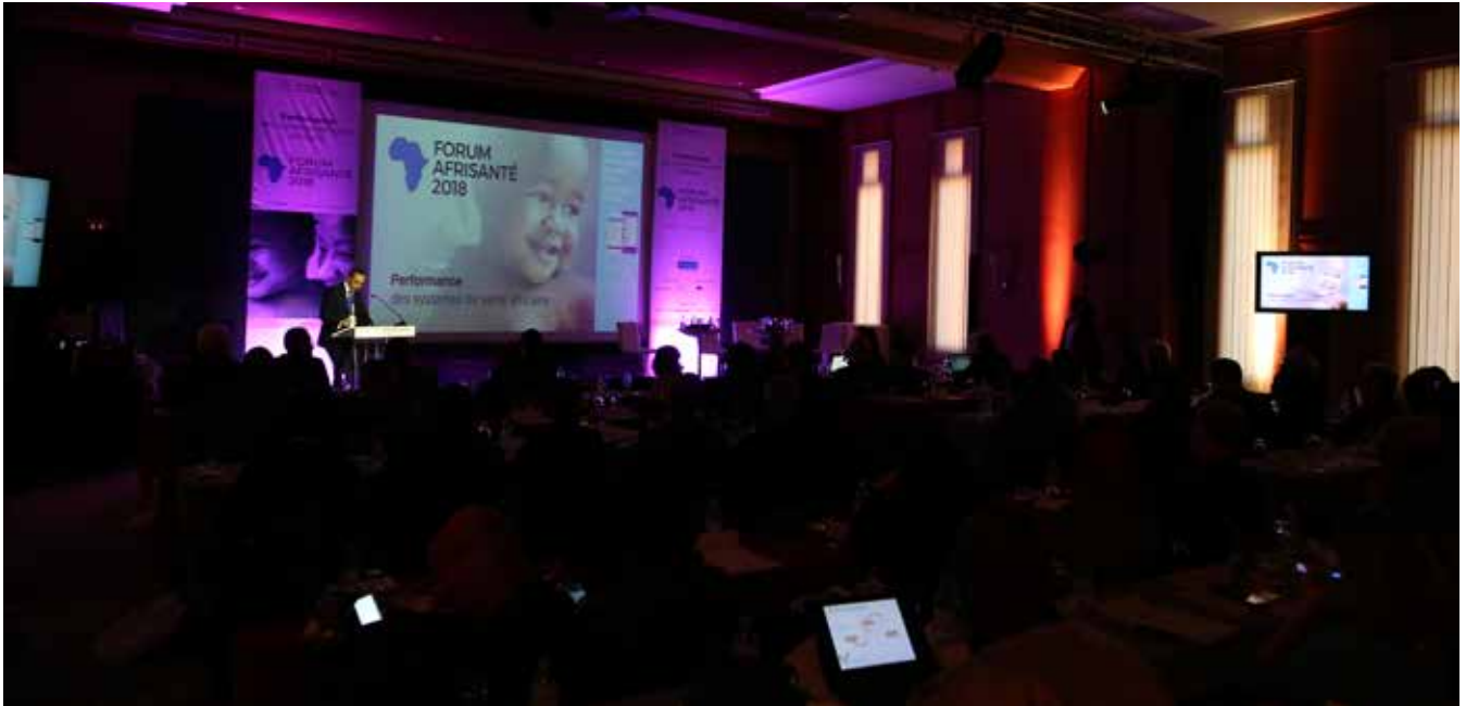
150 participants ont pris part aux travaux de cette édition 2018 du Forum Afrisanté